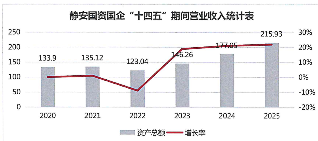
图 3：静安国资国企“十四五”期间营业收入统计表（单位：亿元）

从主营业务收入看，2020年至2025年区管国有企业主营业务收入分别为133.90亿元、135.12亿元、123.04亿元、146.26亿元、177.05亿元和215.93亿元，年均增长率10.03%。其中，2022年主营业务收入略微下滑，一方面是由于疫情房租减免政策，区管企业累计减免租金5.5亿元；另一方面是受疫情封控影响，区管企业业务开展面临极大制约，业务收入出现下滑，2023年营业收入开始稳步回升。