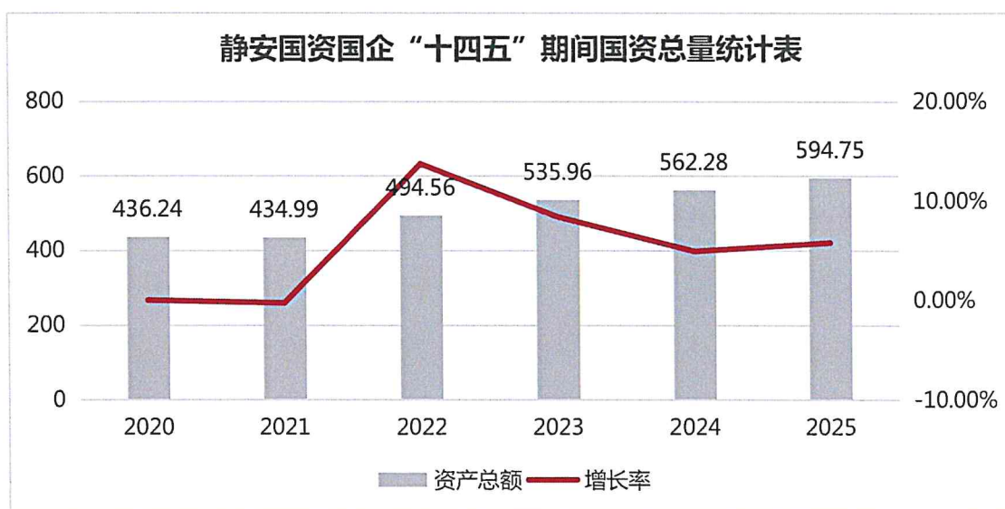
图 2：静安国资国企“十四五”期间国资总量统计表（单位：亿元）

从国有资产总额看，2020年至2025年资产总额分别为1473.28亿元、1502.83亿元、1679.02亿元、2069.40亿元、2192.67亿元和2093.42亿元，其中2021年增长率为2.01%、2022年增长率为11.72%、2023年增长率为23.25%、2024年增长率为5.96%、2025年增长率为-4.53%，年均增长率为7.28%，处于中心城区第一梯队。