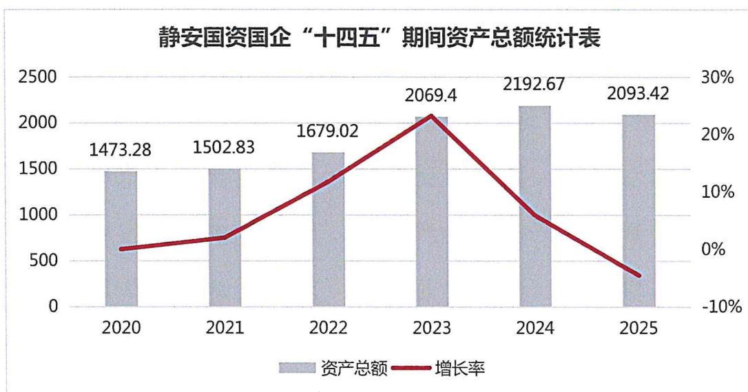
图 1：静安国资国企“十四五”期间资产总额统计表（单位：亿元）