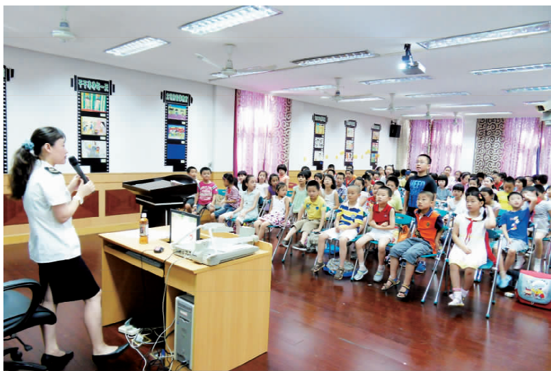
食药监静安分局在万航渡路小学举行小学生食品安全知识宣传

【自制月饼餐饮单位检查】 年内,食药监静安分局对辖区内 1347 家餐饮单位开展全覆盖摸底检查,查实 33 户餐饮单位制售月饼等产品,经详细核查所使用的食品原料、食品添加剂、食品相关产品供货商的相关证照和