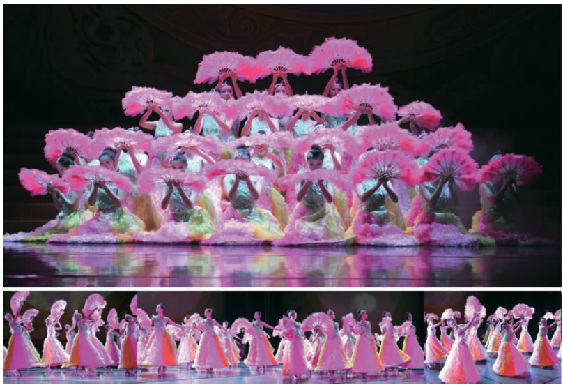
9月26—28日,“金秋情怀——静安国资艺术团中秋·国庆慰问演出”在艺海剧院举行,分别为区机关干部、社区干部、企业职工举办演出

【概况】 2012年,区质量技监局开展质量强区工作,培育服务名牌,推进能源计量,重点关注产品质量、食品生产和特种设备安全。产品质量监督中,出动执法人员624人次,检查单位200余家次;开展“质检利剑”“双打”“清新居室”“节能减排”等专项检查;对区内11家全国工业产品生产许可证、中国强制性产品认证(“3C”)获证企业开展日常检查,帮助企业整改