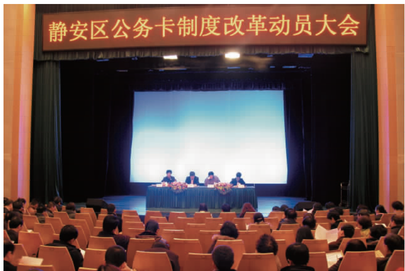
3月8日,静安区公务卡制度改革动员大会在区政府十楼会场召开

【小微企业信用贷款试点推荐】 4月,区财政局启动小微企业信用贷款试点推荐工作,通过无抵押信用贷款方式,解决部分资质优良、有发展潜