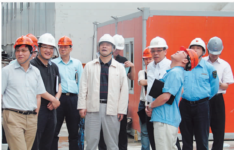
6月15日,副区长赵永峰(左四)带队检查嘉里商务中心工地

【消防安全和安全生产社区工作者队伍组建】 4月,区安监局招聘录用 36 名消防和安全生产社区工作者(简称消安社工),并对其进行上岗前培训。36 名消安社工分布在静安区 5 个(社区)街道,1 个消安社工管辖范围基本上为 2 个居委会。负责对辖区内生产经营单位安全生产开展监督检查,对辖区内单位和居民住宅小区消防安全开展监督检查;向有关部门报告已经发生的安全生产事故和火灾火情,协助督促整改;指导社区居民制